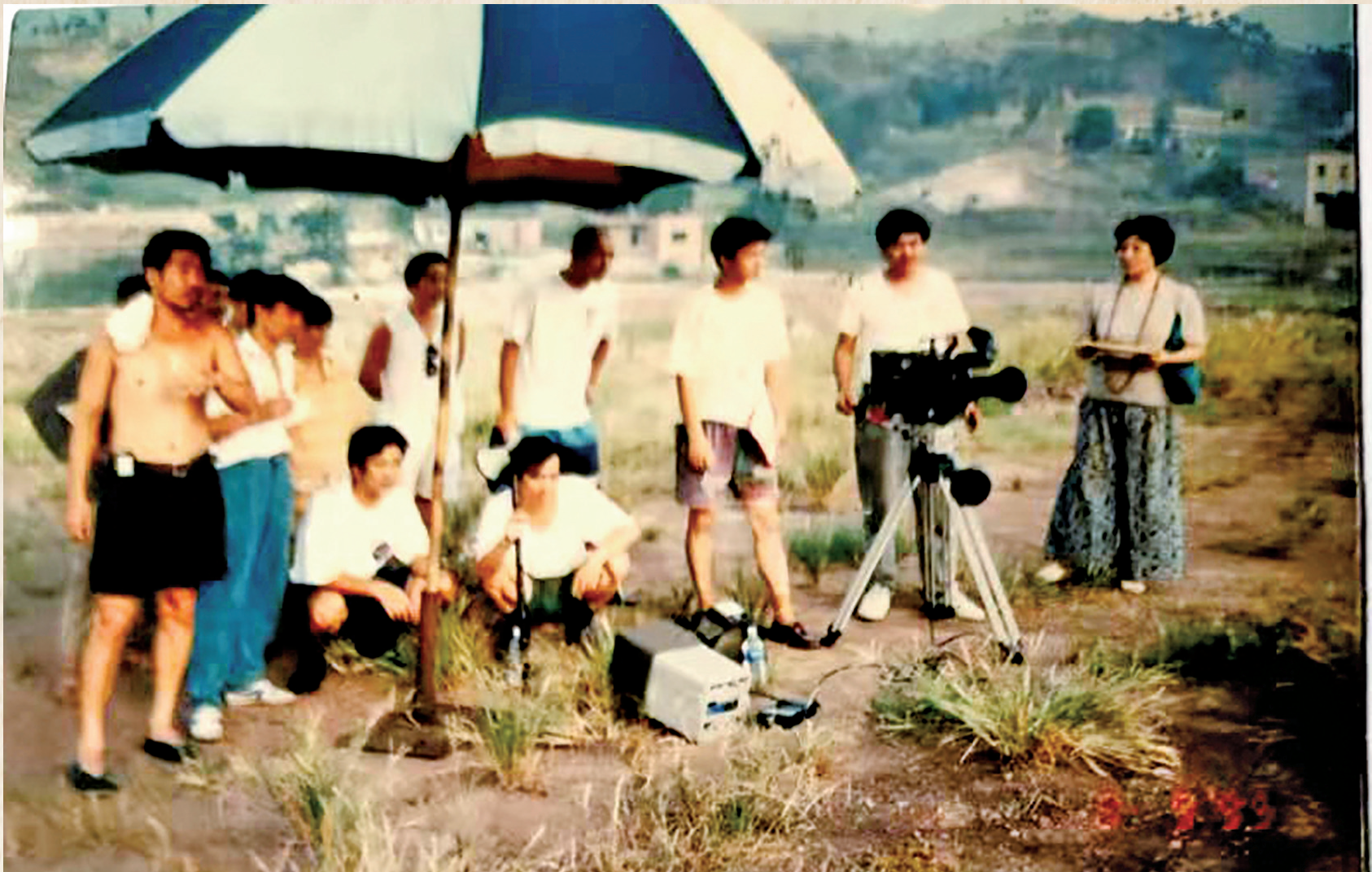
电视剧《魂归》摄制现场。