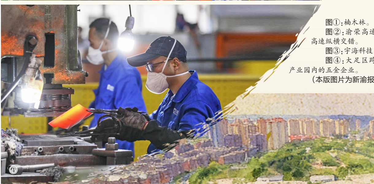
图①：楠木林。 图②：渝蓉高速与大内高速纵横交错。 图③：宇海科技。 图④：大足区跨境电商产业园内的五金企业。