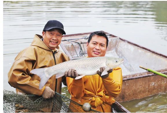
刚捕捞起的脆鲩鱼。