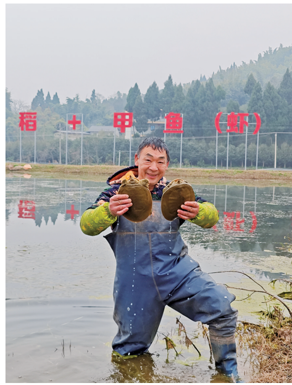
高升镇稻甲基地，养殖技术人员正在抓甲鱼。

新渝报讯春耕时节，大足区高升镇太和村一派繁忙景象，记者在现场看到，三五辆挖掘机正在开垦400亩高标准农田。当地工作人员介绍，一个新的“稻+甲鱼”基地将在这里落成。