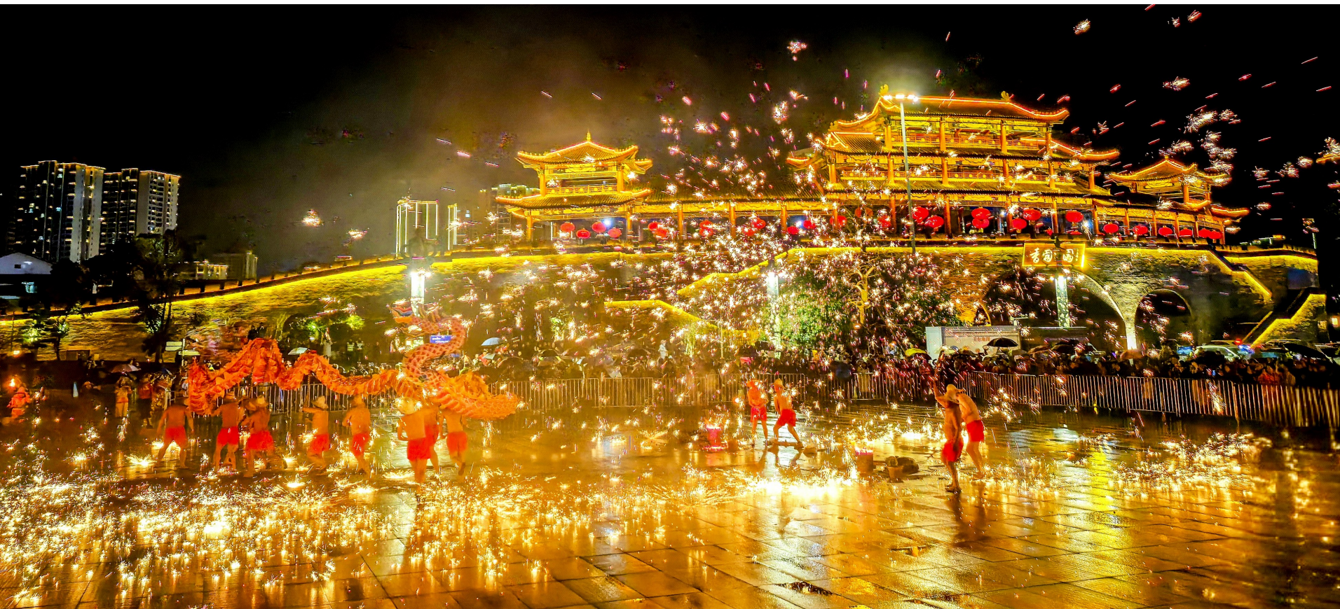
3月15日—17日,大足石刻国际旅游文化节昌州夜宴在香国公园举行,中救火龙、打铁花等民俗表演一一上阵,吸引了众多市民前往观看。