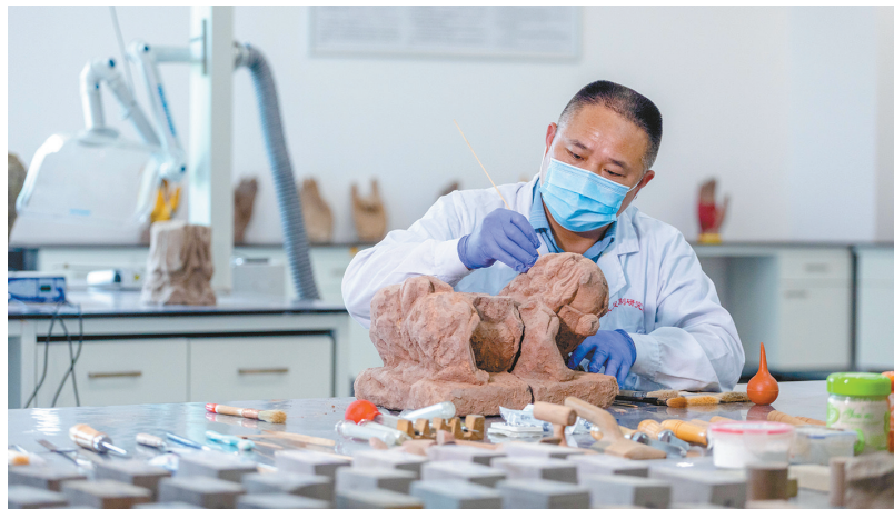
文物医生正在修复出土文物。