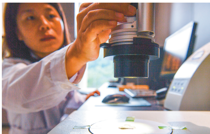
显微镜下进行文物成分分析。