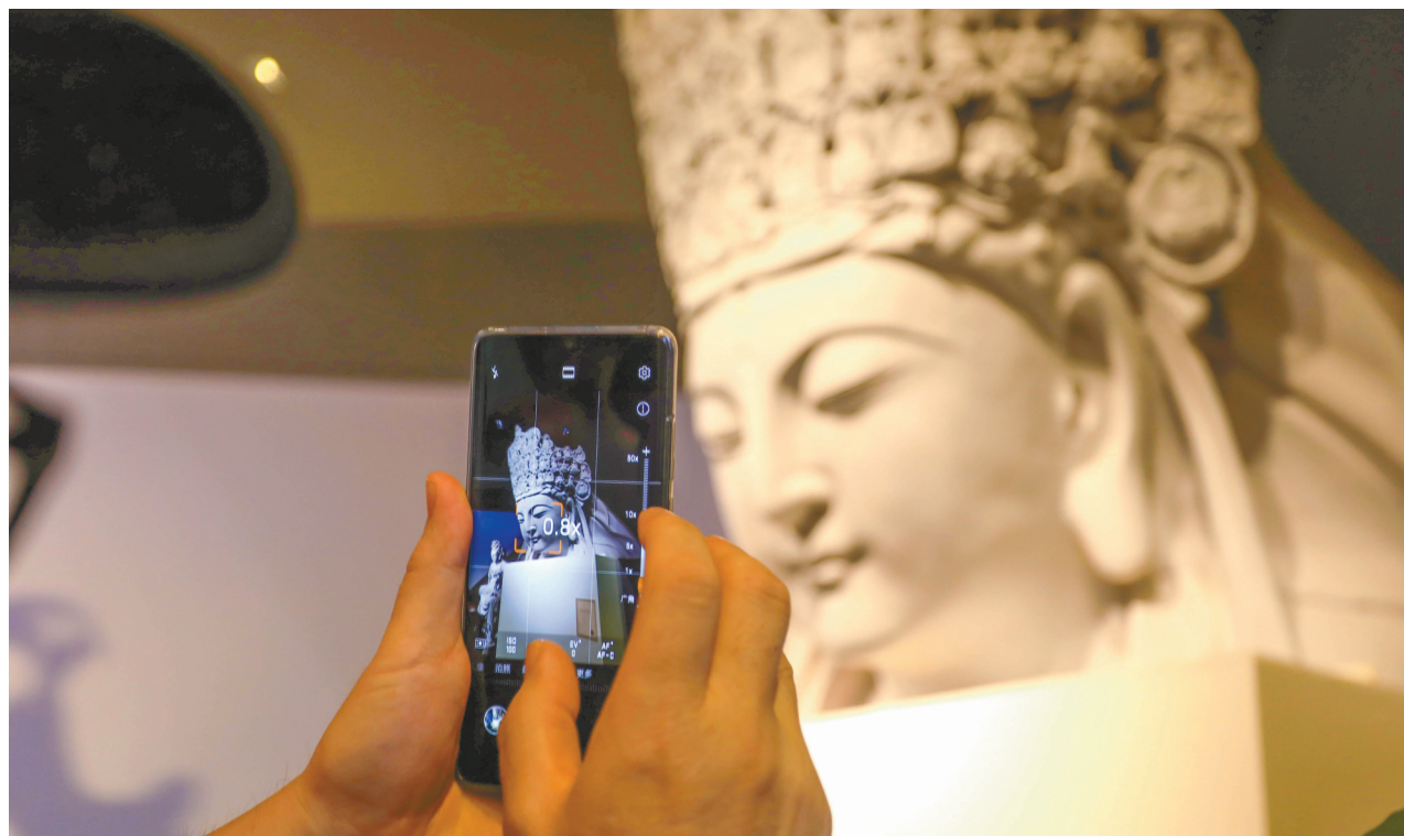
3D打印的大足石刻千手观音主尊头像受市民青睐。