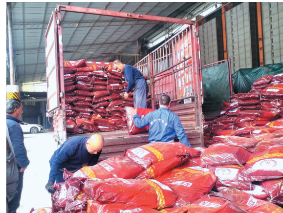
永川扩种粮油获国家增补农资发放现场。