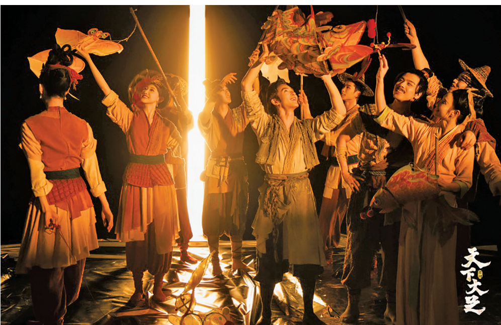
舞剧《天下大足》剧照。

“跟着舞剧游大足”活动是由大足区邀请舞剧观众游览大足。大足区会在每个巡演城市投放1000张大足石刻套票及文创礼包,观众可通过现场扫码抽奖、加入抖音话题等方