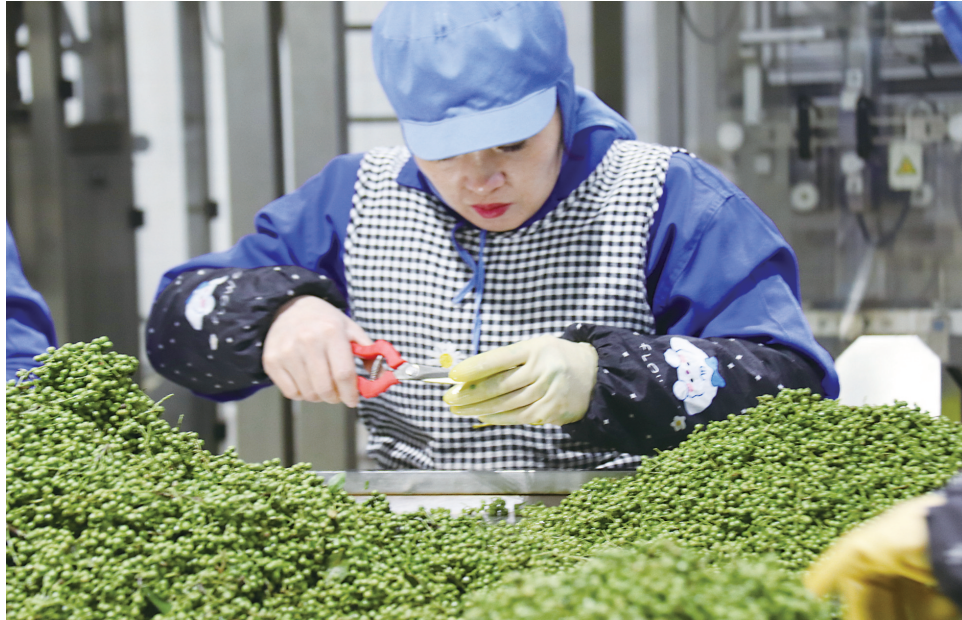
工人将青花椒的细枝剪断。

“江津花椒机械化示范基地”的牌子,通过在采摘运输环节,采用电动剪刀、山地轨道车、无人机等设备,降低生产管理成本,提升种植效益;“创新”正在成为椒农们的共识。不少合作社负责人说,无论是枝条调节更新、留枝采收、带果烘烤等技术,都在创新中不断“尝鲜”,“作为先锋,不能躺在过去的成绩上睡觉。”“椒乡”人不仅创建出口基地开拓海外市场,还在研发、精深加工产品上下功夫,让小小的花椒从调味品向休闲食品、护肤品、药品延伸,不断提升附加值。近年来,先锋镇重点推动了一批发展潜力大的项目加快落地,江津国际花椒产业城、近贤数字经济产业园等项目的布局,将为先锋产业发展注入强劲动能。