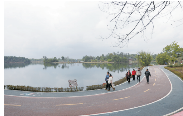
2月3日,大足区龙湖春光明媚,市民在此沿着环湖步道骑行、游玩,感受立春时节的美好时光。