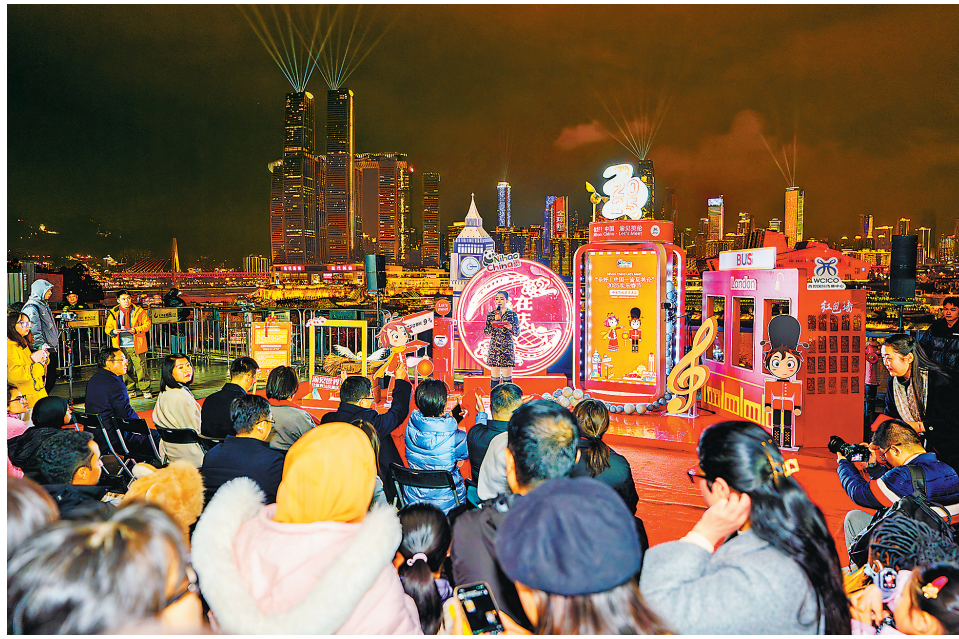
2月6日,位于南岸区的长嘉汇城市观景平台,众多市民前来参与互动交流活动。

据介绍,伦敦国王十字车站是《哈利·波特》系列小说和电影中霍格沃兹特快列车的出发地,其第九和第十站台之间专门设置了打卡点,成为伦敦最受欢迎的旅游景点之一。长嘉汇城市观景平台位于长嘉汇购物公园内,以弹子石老街为代表,该区域汇集了大禹治水、青云桥等一系列传说典故,成为市民游客喜爱的游览观光点。市民朋友可前往“时空魔镜”打卡,穿梭奇妙的“魔幻之门”,活动将持续至2月10日。