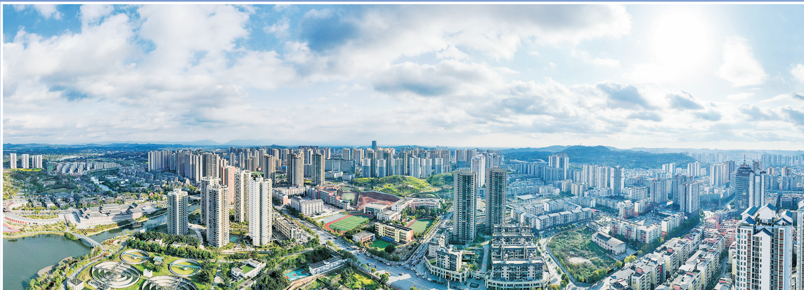
大足城区