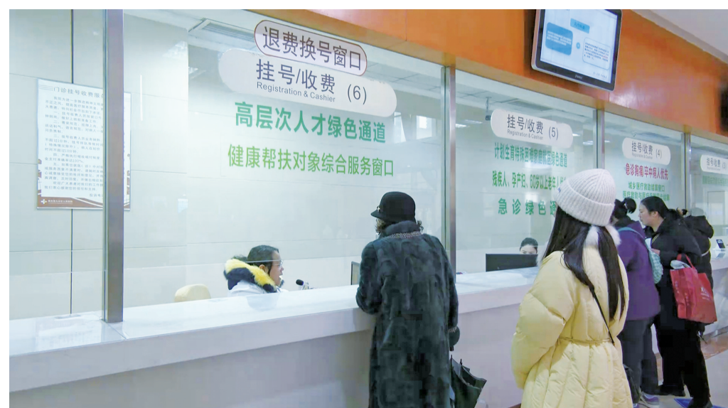
大足为高层次人才开通“医疗绿色通道”。