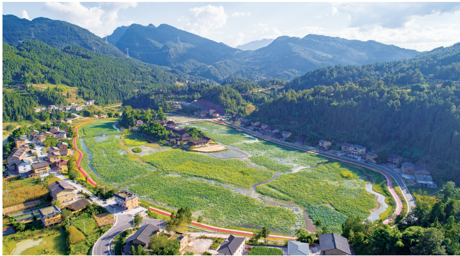
武隆区沧沟乡大田湿地人家乡村旅游点。(武隆报资料图)

“七八月份，湖里的荷花全部开的时候，那更是漂亮得很哦，来的游客也越来越多了。”村民们看到实实在在的人气，对大田村的未来充满了希望。