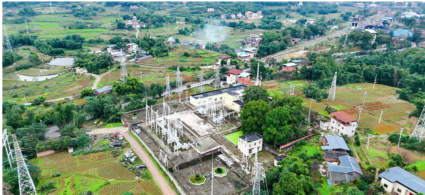
如今的110千伏园通变电站全景。

“在电力极其匮乏、宝贵的年代里，110千伏园通变电站不仅满足了永荣矿务局的生产用电所需，推动了当时以永川为核心的周