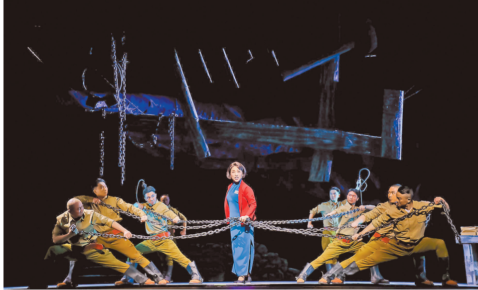
川剧《江姐》演出现场。

“小说《红岩》出版后不但深受读者喜爱,而且吸引了全国文艺界争相根据红岩题材进行改编创作。”武汉大学文学院教授樊星介