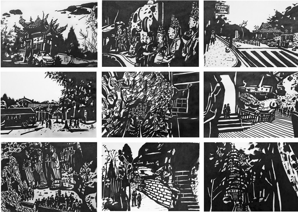
《巴蜀文脉——川渝石窟造像》系列组画中部分关于大足石刻的画作。

黄剑武说，川渝文化同根同源，巴蜀石窟本属一脉，大足石刻保存比较完整且最具代表性。时代变迁，看石窟的人的审美情趣也在改变，他想通过《巴蜀文脉——川渝石窟造像》的系列组画，用现代人的观看方式来表现川渝地区的代表性石窟的审美性、关联性和现代性。