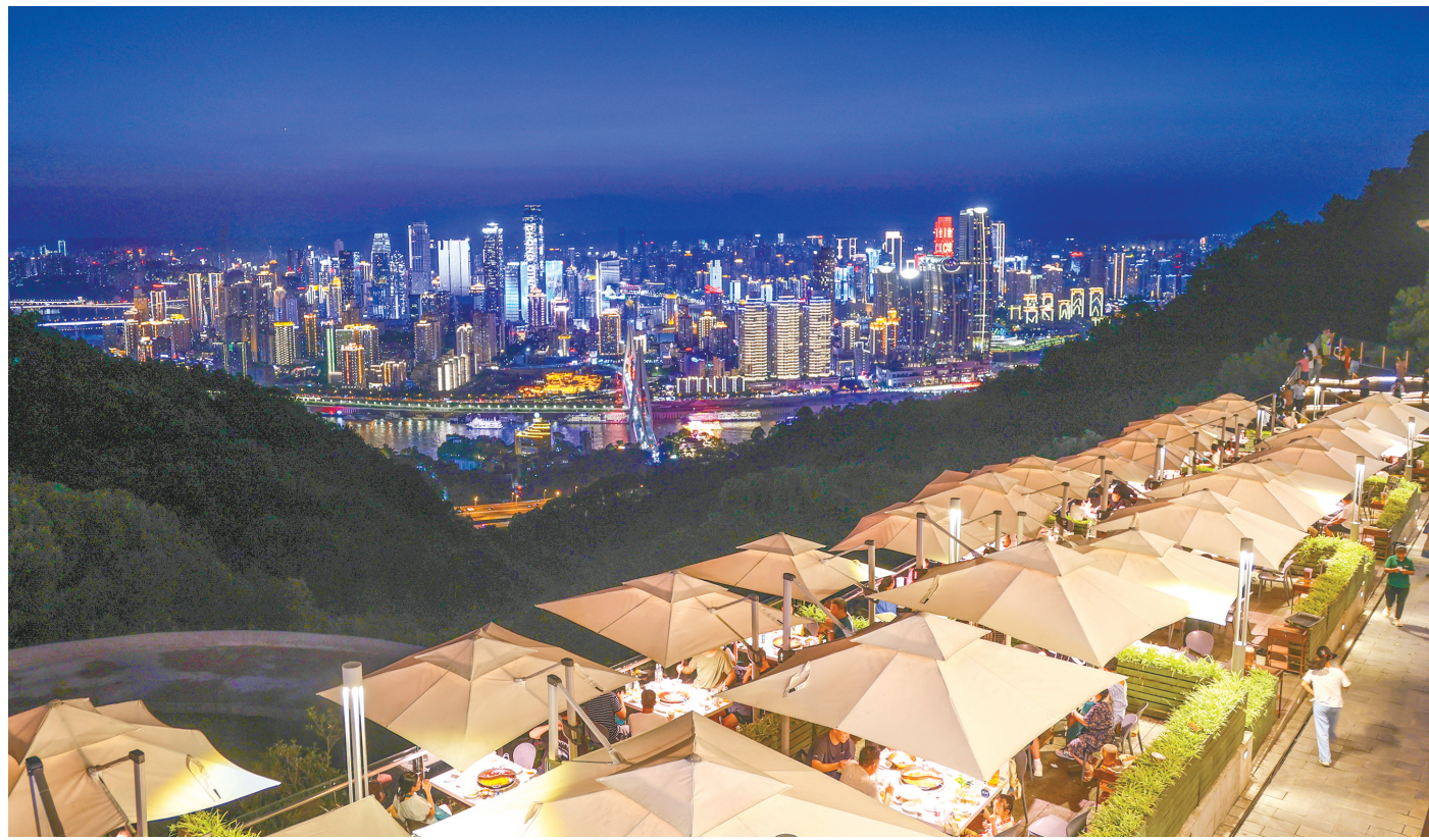
八月二十三日，重庆南岸区南山风景区内一家网红火锅店，游客们一边品火锅，一边欣赏重庆迷人的夜景。

为了让户外劳动者也能享受到山城重庆夏日的“清凉”，重庆市还设置了数百个“劳动者港湾”，为他们提供防暑空间。在这个空调、冰箱、微波炉、防暑药品等一应俱全的小