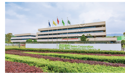
重庆百亚卫生用品股份有限公司