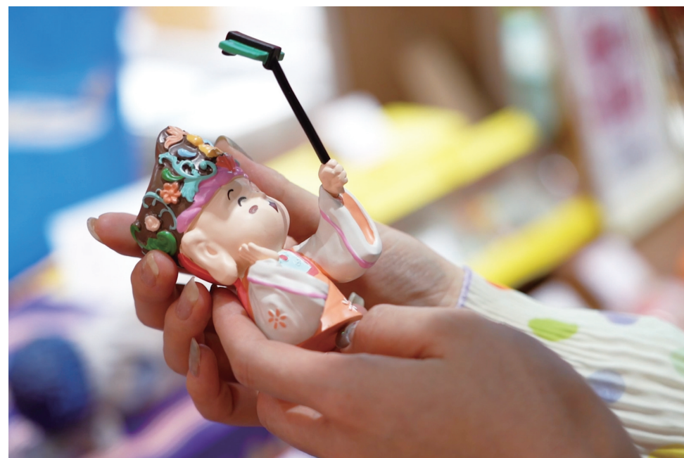
“石刻旅行家”盲盒手办。

下一步,该集团还将持续加大研发投入,不断开拓创新领域,进一步提高文创产品的质量和多样性,让更多的人能够感受到大足石刻文创的独特魅力,为推动大足石刻文化的传播与发展贡献更强劲的力量。