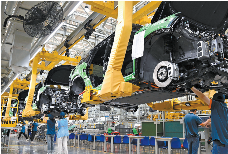
在位于沙坪坝区的赛力斯凤凰智慧工厂,工人正在总装车间作业。

今年初,重庆快联汽车零部件有限公司通过沙坪坝区开展的“专班式”企业服务,实现一网通办、并联审批、多证联发。企业在缴纳土地契税之后,一站式、零等待依次取得“建设用地许可证、不动产权证、建设工程规划许可证、施工许可证”四证,既节省了沟通时间成本,也免除了方案设计成本,极大提升了企业投资和建设便利度。