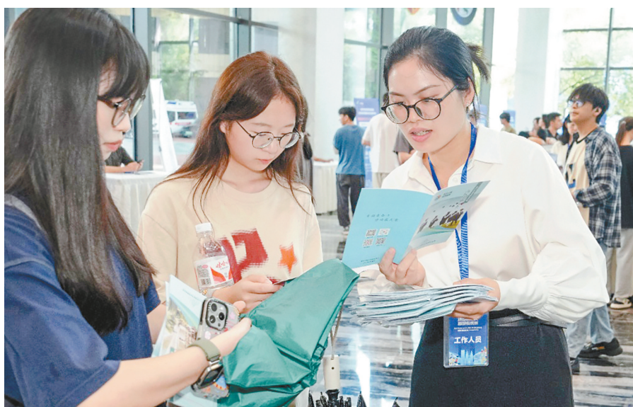
日前,重庆两江影视动漫文创园,工作人员在给大学生讲解就业创业相关政策。

若遇公共就业服务机构或街道社区工作人员电话回访、上门走访,请积极主动提供本人就业意向、自身需求等信息,以便更好地提供服务。