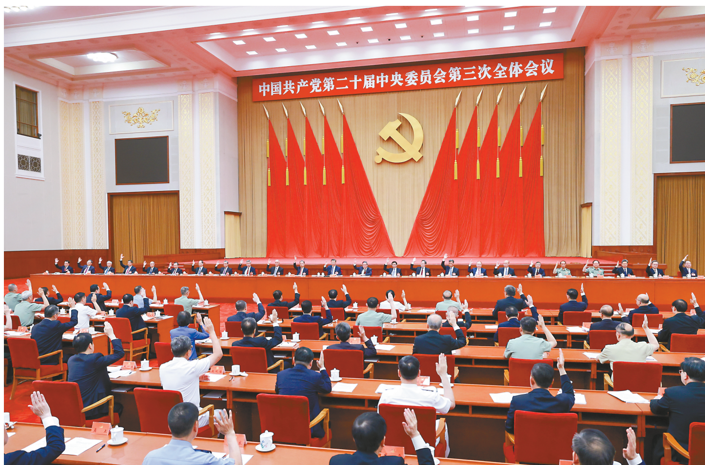
中国共产党第二十届中央委员会第三次全体会议，于2024年7月15日至18日在北京举行。中央政治局主持会议。