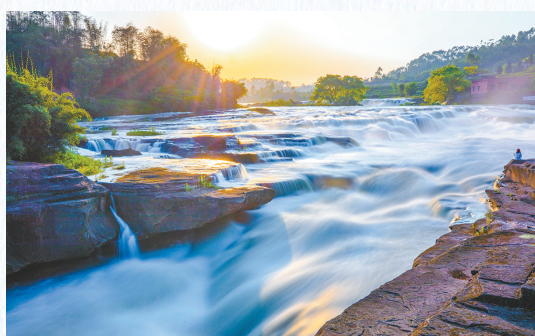
二坪镇老虎口瀑布