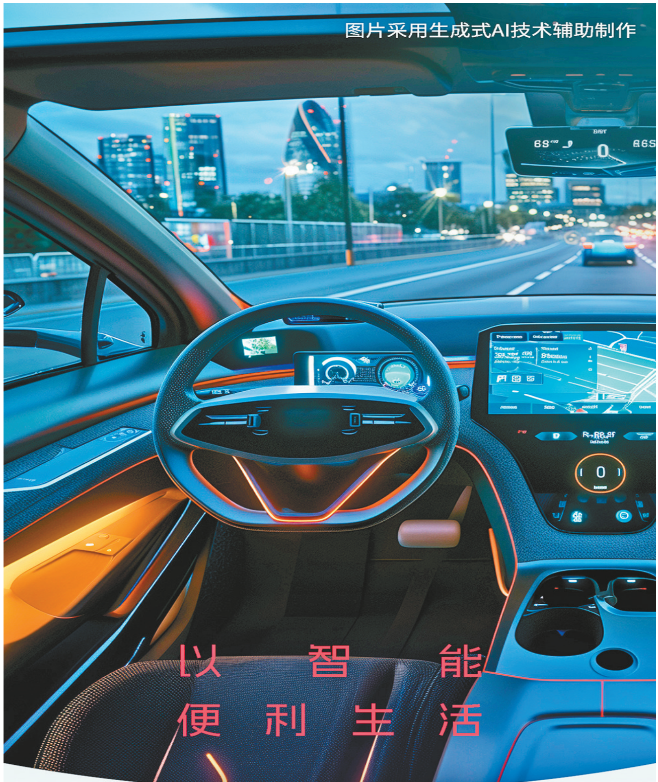
图片采用生成式AI技术辅助制作

“梁平是国家储备林项目重庆4个首批试点区县之一，已累计完成投资12亿元，盘活闲置林地资源35.8万亩，开展营造林建设24.68万亩，完成双桂湖及城市周边高品质绿化1000亩，打造优质林下甜茶基地2000亩。”梁平区林业局有关负责人表示，2024年，他们还将大力推进“储备林+”产业发展，打造全市乃至全国国家储备林建设样板地。