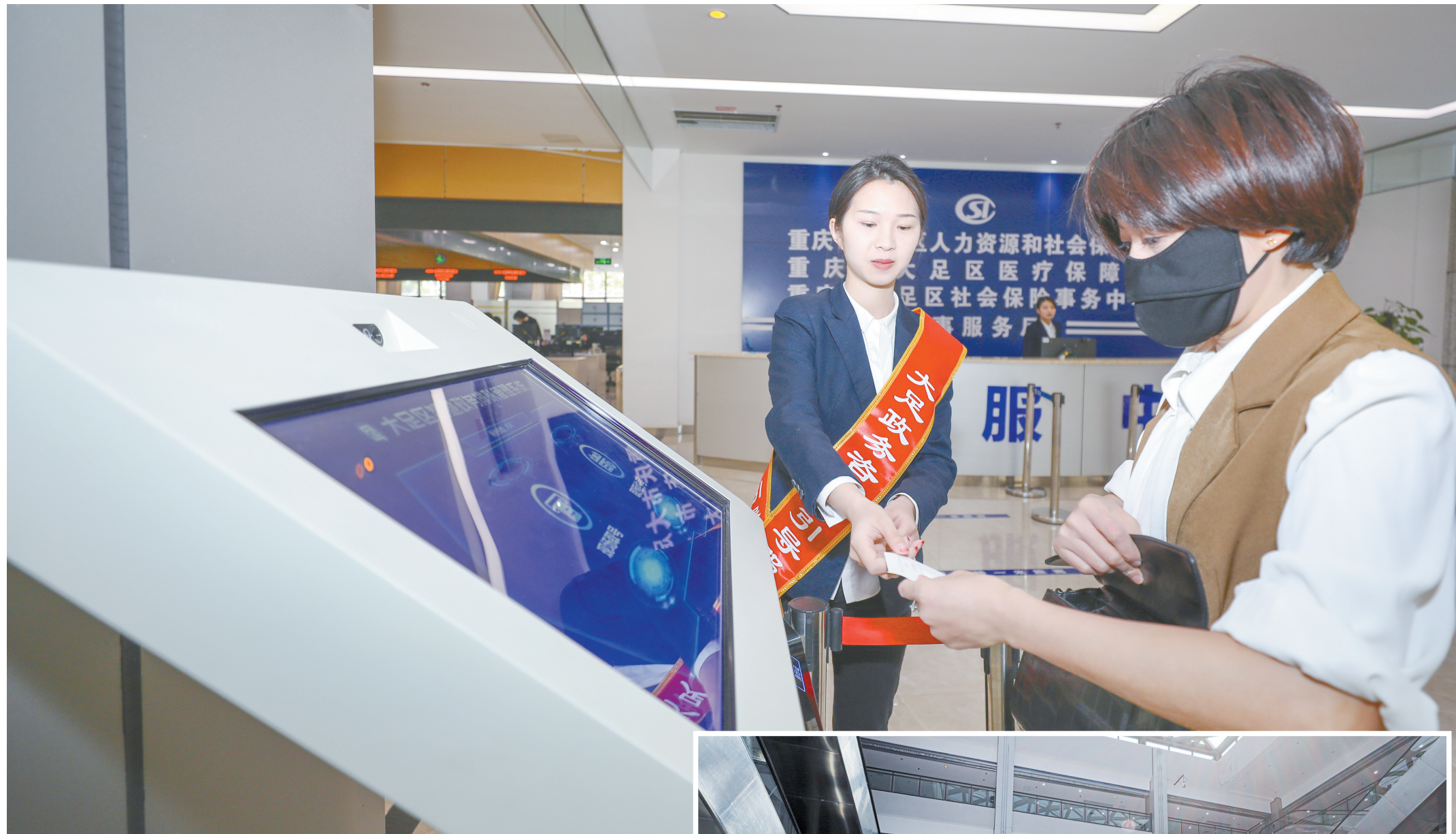
工作人员为市民办理业务。(资料图)

袁果表示，在加快建设渝西地区全面深化改革先行区上，大足将持续完善“116N”工作体系，健全三级调度、协同推进等机制，对重点改革项目分类施策、精准突破、动态跟踪，做到一个项目、一个团队、一套方案、一抓到底。未来，还将大力培育改革典型案例，定期举办改革经验交流会，讲好大足改革故事，在全社会营造崇尚改革、大胆创新的良好氛