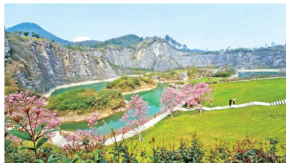
渝北铜锣山矿山公园。