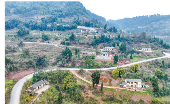
宝顶镇香山社区于家沟。