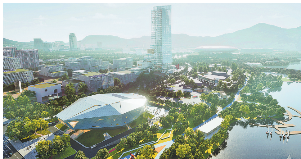
电竞馆项目位于璧山区梦界空间数字经济产业园。

约23.8亩，建筑面积超1万平方米，包括比赛区、后台区、观众区、外场区等功能区，可同时容纳2000名观众观赛。