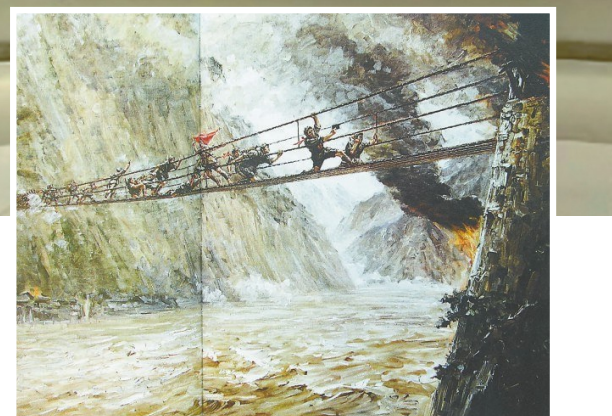
油画《飞奔泸定桥》 刘国枢