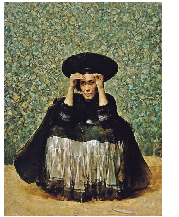
油画《苹果熟了》 庞茂琨