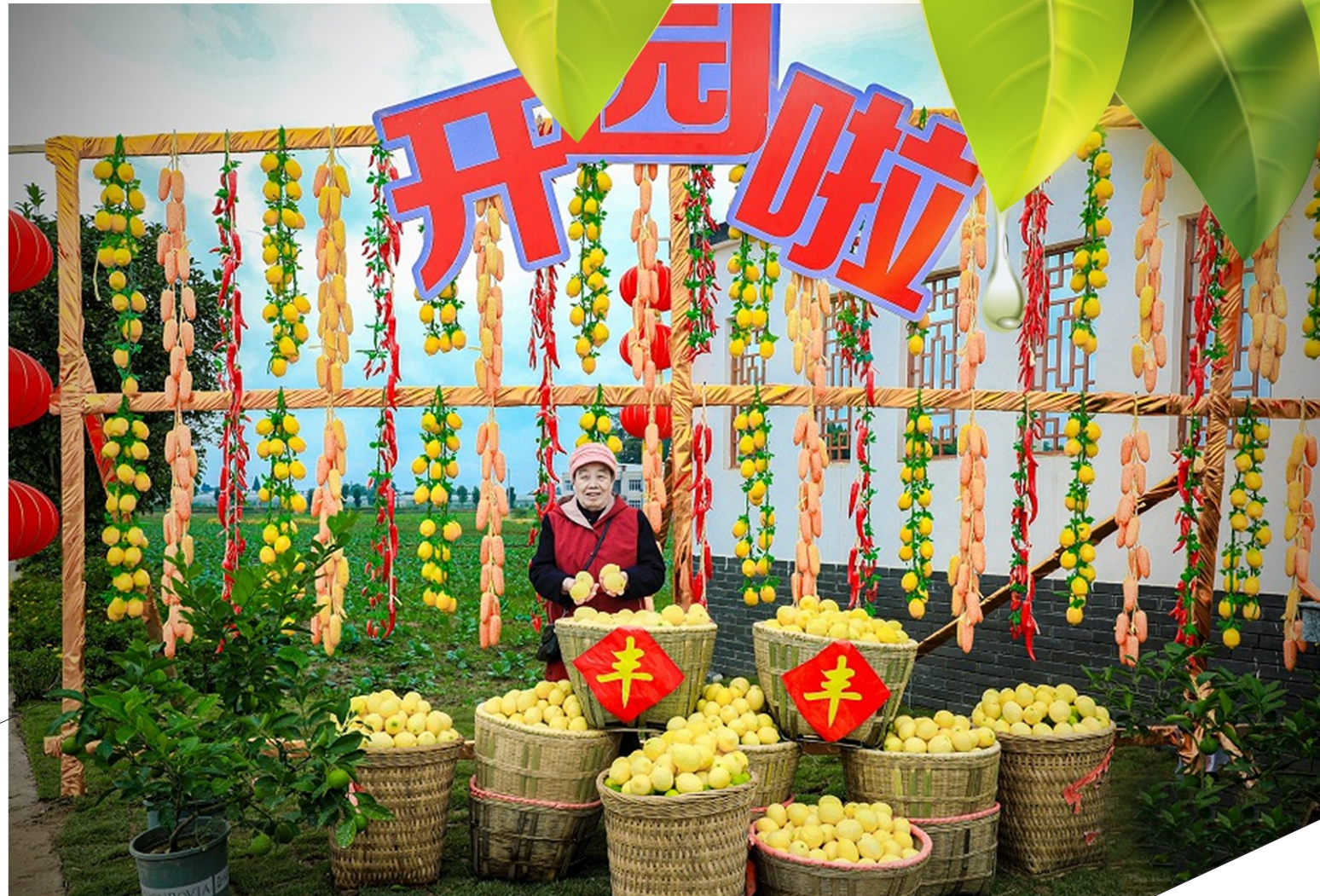
潼南柠檬丰收。