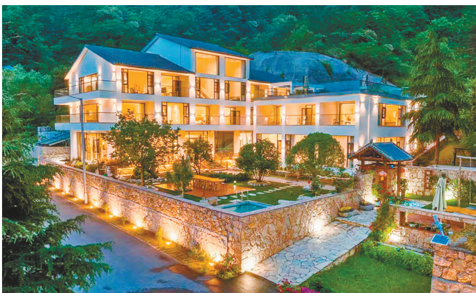
洛阳栾川县伏牛山名宿。

新安有“黄河人家”民宿品牌,孟津区有九泉民宿项目,洛宁县有环全宝山、环峨嵋山、环神灵寨等民宿集群。 洛阳市在民宿建设提升、民宿业态丰富、民宿消费升级上持续发力,“民宿+农事体验”“民宿+户外运动”“民宿+非遗展演”等,给游客带来了全新的体验,这些高档民宿集群独特的魅力,真正把游客引进来、把情留住来,让时光慢下来。