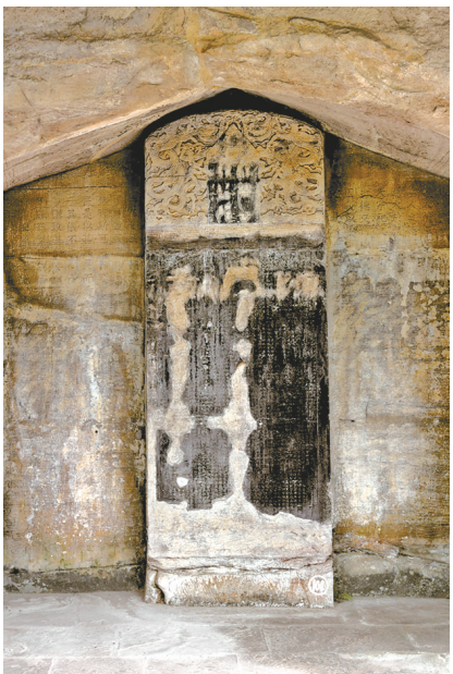
南宋赵懿简公神道碑。

据了解,2022年,重庆市开展了碑刻石刻文物资源调查工作,总计调查不可移动碑刻石刻文物资源764处3258方(通),可移动碑刻石刻文物资源516件(套)。