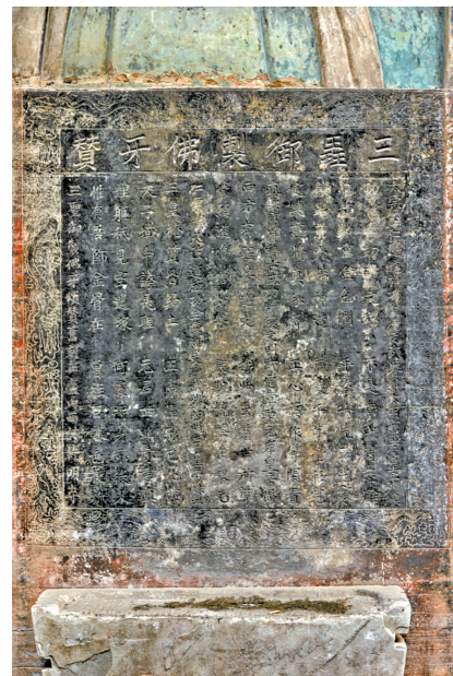
南宋三圣御制佛牙赞碑。