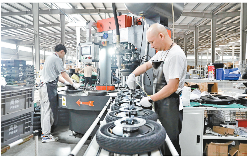
大足高新区内,工人正在摩托车生产线上忙碌。

上半年,大足区就业形势总体稳定,城镇新增就业人员6872人,发放创业担保贷款1.57亿元,带动就业1800余人。发放失业保险金2501万元,帮助1.5万人次就业过渡。实施“百千万”引才工程,引进教育、卫生、农业等人才405人,