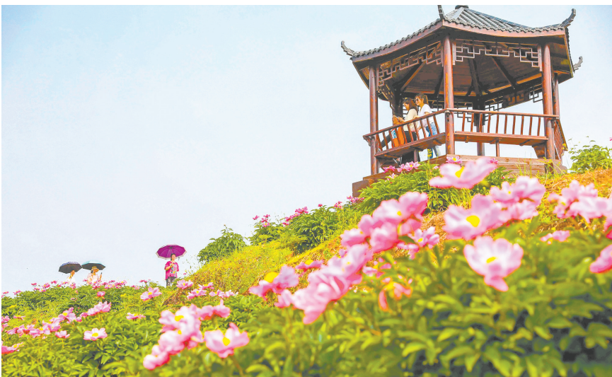
垫江县曹回镇徐白村芍药花基地。