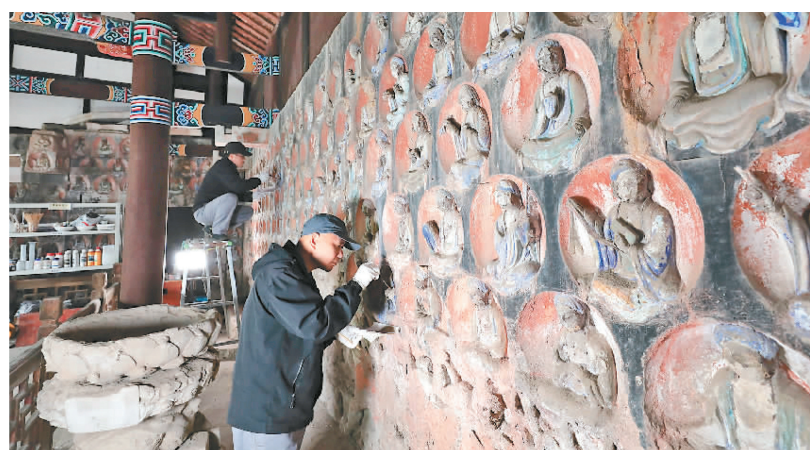
2023年3月31日，大足石刻小佛湾修复现场，修复人员正在对石窟造像进行清理。小佛湾石窟保护修复工程于2019年6月启动，目前已完成整个工程量的六成。新渝报记者 黄舒 摄

现了宗教教义，也呈现了宋代生动的生活场景。”大足石刻博物馆讲解员余俐介绍，建于北宋的石篆山摩崖造像为典型的释、道、儒“三教”合一造像区，其中，第6号为孔子及十哲像，正壁刻儒家创始人孔子坐像，两侧壁刻孔子十大弟子；第7号为三身佛龛；第8号为老君龛，正中凿道教创始人老子坐像，左右各立7尊真人、法师像。大足石刻造像中，无论是佛、菩萨，还是罗汉、金刚以及各种侍者，都颇似现实中各类人物的真实写照。宝顶山摩崖造像所反映的社会生活场景十分广泛，俨然是一座宋代民间风俗画廊。