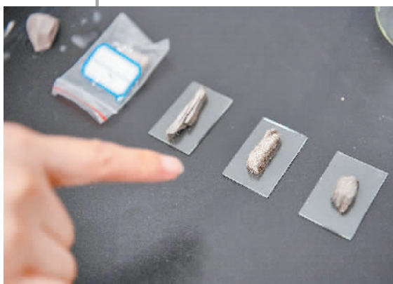
工作人员在大足石刻文物医院进行“制样”工作。

大足石刻博物馆属于石窟寺遗址类博物馆，其藏品主要包括以北山、宝顶山、南山、石门山、石篆山等“五山”石窟为代表的野外不可移动石窟寺遗址和文物库房内的石刻、陶瓷、木器、字画等可移动文物，各级文物保护单位多达75处。