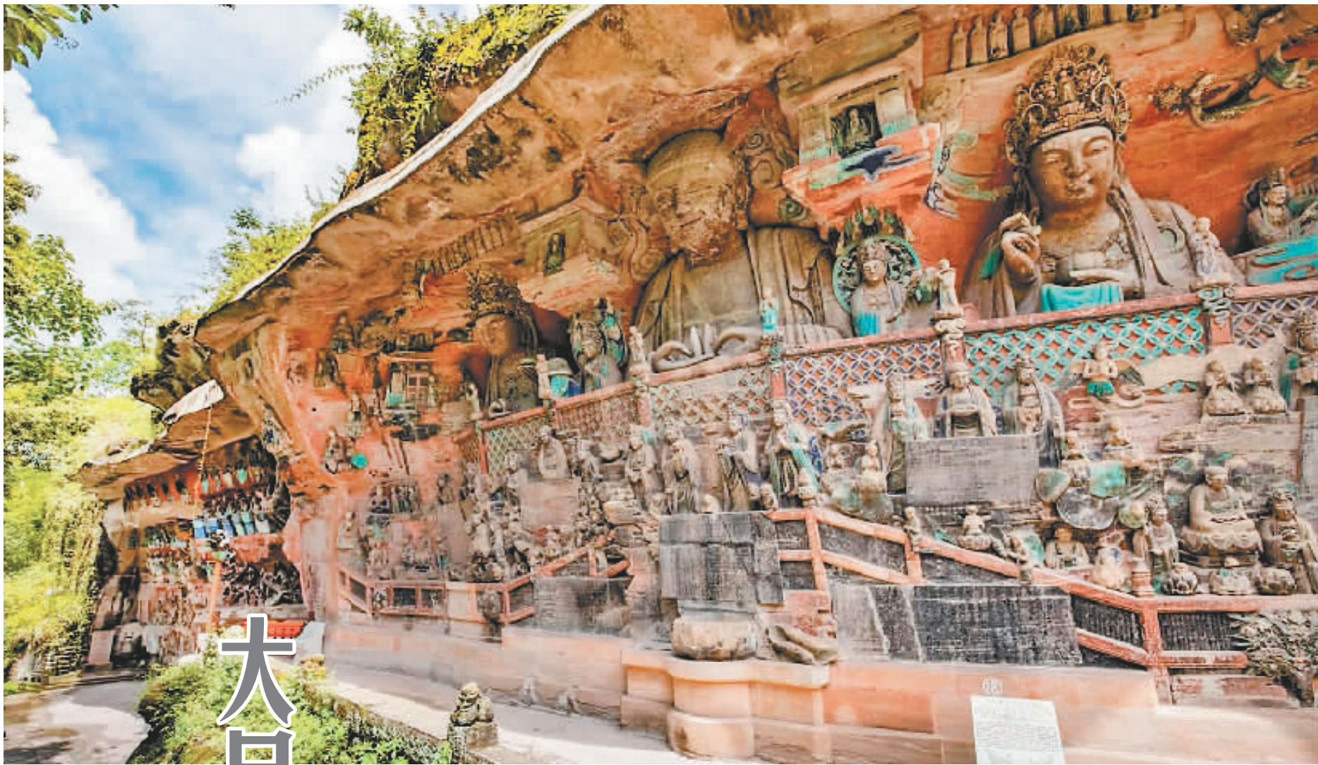
大足石刻宝顶山大佛湾局部。罗国家 摄