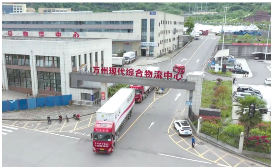
满载着白羊镇柠檬的陆海新通道跨境班车驶出万州现代综合物流中心。

快建设铁公水空基础设施、重点枢纽场站以及万达开多式联运合作试验区，争取开通舟山—万州—达州海江铁联运通道，提高物流运输效率。”