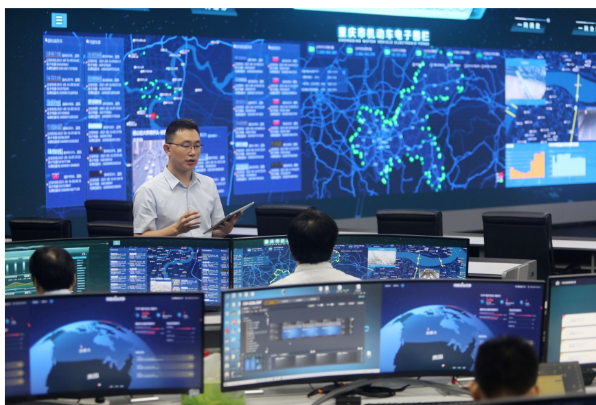
重庆市新型智慧城市运行管理中心,“城市大脑”正在高效运转。

数字时代,变革之中蕴藏无限可能。当前,重庆市域治理方式、手段、工具、机制正在迎来系统性重塑。以此为契机,压实各方责任,完善工作机制,加快业务培训,强化人才支撑,主动塑造数字变革新优势,积极拥抱数字文明新时代,就一定凝聚起推进数字重庆建设的强大合力,将数字重庆建设打造成为现代化新重庆标志性成果。