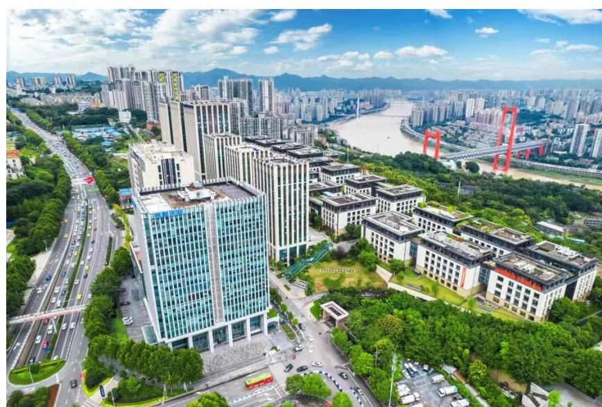
有“重庆链岛”之称的渝中区大石化新区数字产业园。