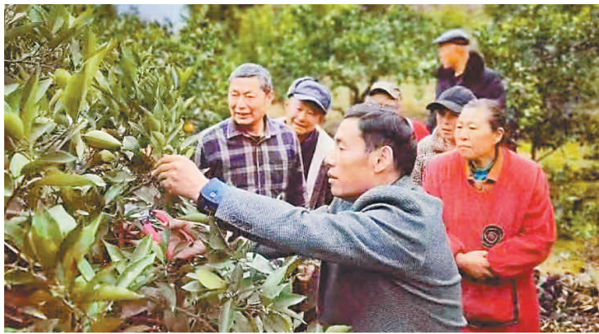
供销社技术服务队正在向村民们讲解技术。

“随着人们生活水平的提高,小散乱的销售模式已经没有竞争力了,奉节脐橙更需要抱团发展,走品质化、集约化路线。”奉节县供销社相关负责人说,接下来,他们将积极丰富产品供给形式,用好电商等互联网销售平台,完善奉节脐橙供应链系统,实现奉节脐橙从田间地头直达市民餐桌。