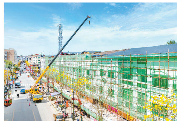
4月4日，施工队正在对雅溪场镇沿街楼顶层进行翻新。

新渝报讯(记者 余佳)4月4日，记者从大足区住房城乡建委了解到，2022年，雅溪镇、玉龙镇被确定为大足区小镇“焕新”建设试点场镇，分别投入资金2389.4万元、1800万元，目前两个试点场镇“焕新”项目建设已基本完工。