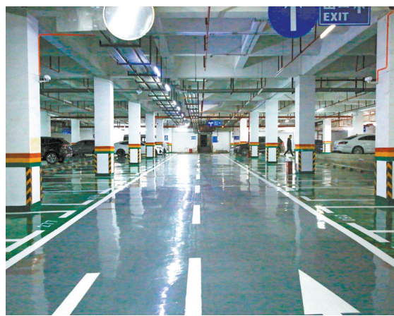
金星家园小区车库