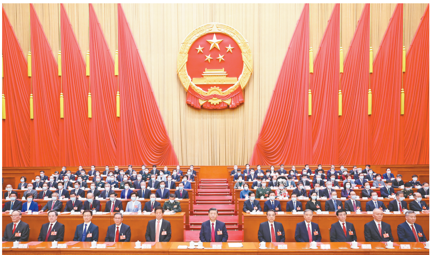
3月13日，第十四届全国人民代表大会第一次会议在北京人民大会堂闭幕。习近平等党和国家领导人在主席台就座。

新华社北京3月13日电 中华人民共和国第十四届全国人民代表大会第一次会议，在圆满完成各项议程，产生新一届国家机构组成人员后，13日上午在北京人民大会堂闭幕。