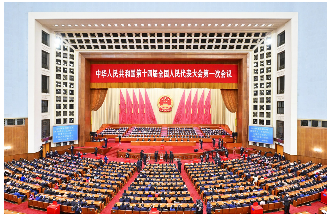
3月12日，十四届全国人大一次会议在北京人民大会堂举行第五次全体会议。

新华社北京3月12日电 十四届全国人大一次会议12日上午在北京人民大会堂举行第五次全体会议，决定国务院其他组成人员。国家主席习近平签署第二号主席令，根据大会的决定，对这次大会表决通过的国务院其他组成人员予以任命。