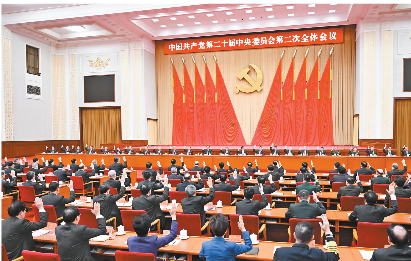
中国共产党第二十届中央委员会第二次全体会议，于2023年2月26日至28日在北京举行。中央政治局主持会议。