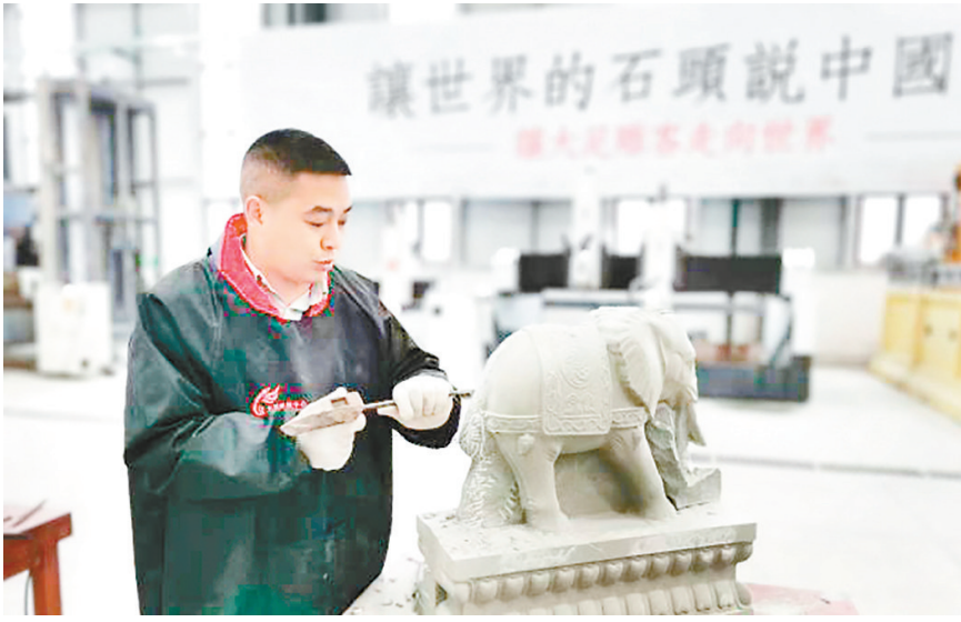
大足石刻工匠正在雕刻。

重庆市大足区三驱镇党委书记、大足石刻文创园党工委书记、管委会主任唐陈表示,现在一些雕刻作品需要数控