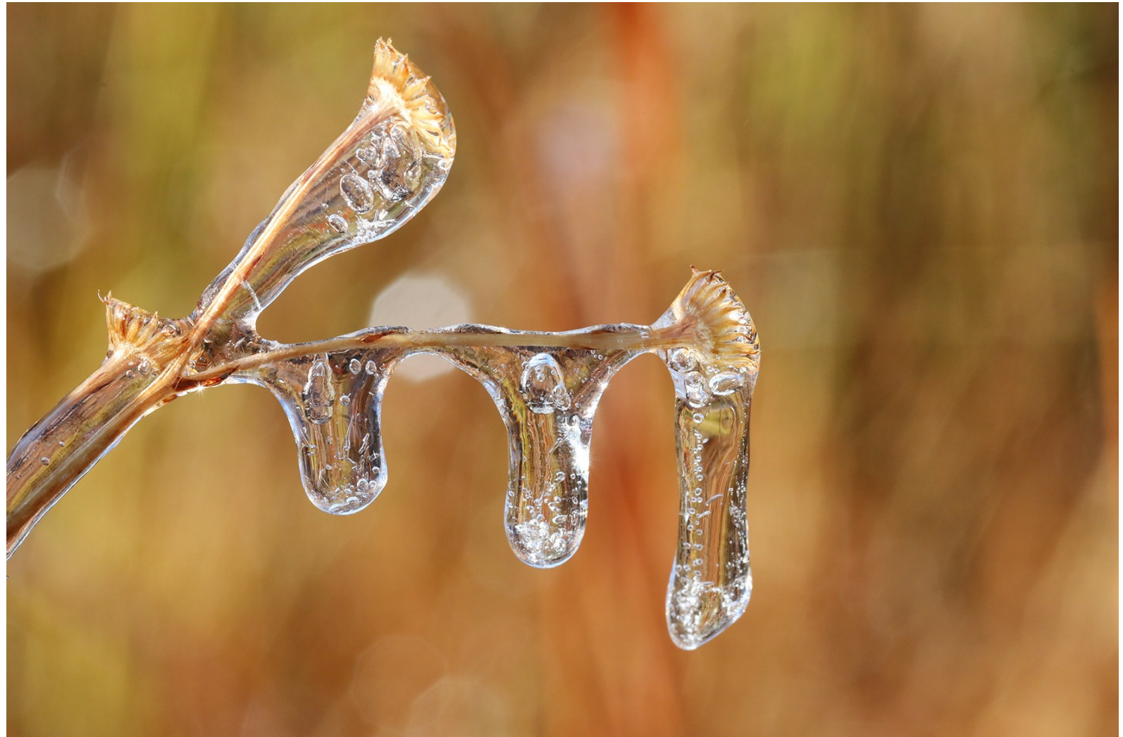
11月30日,在云南省腾冲市马站乡,草杆结冰凌。