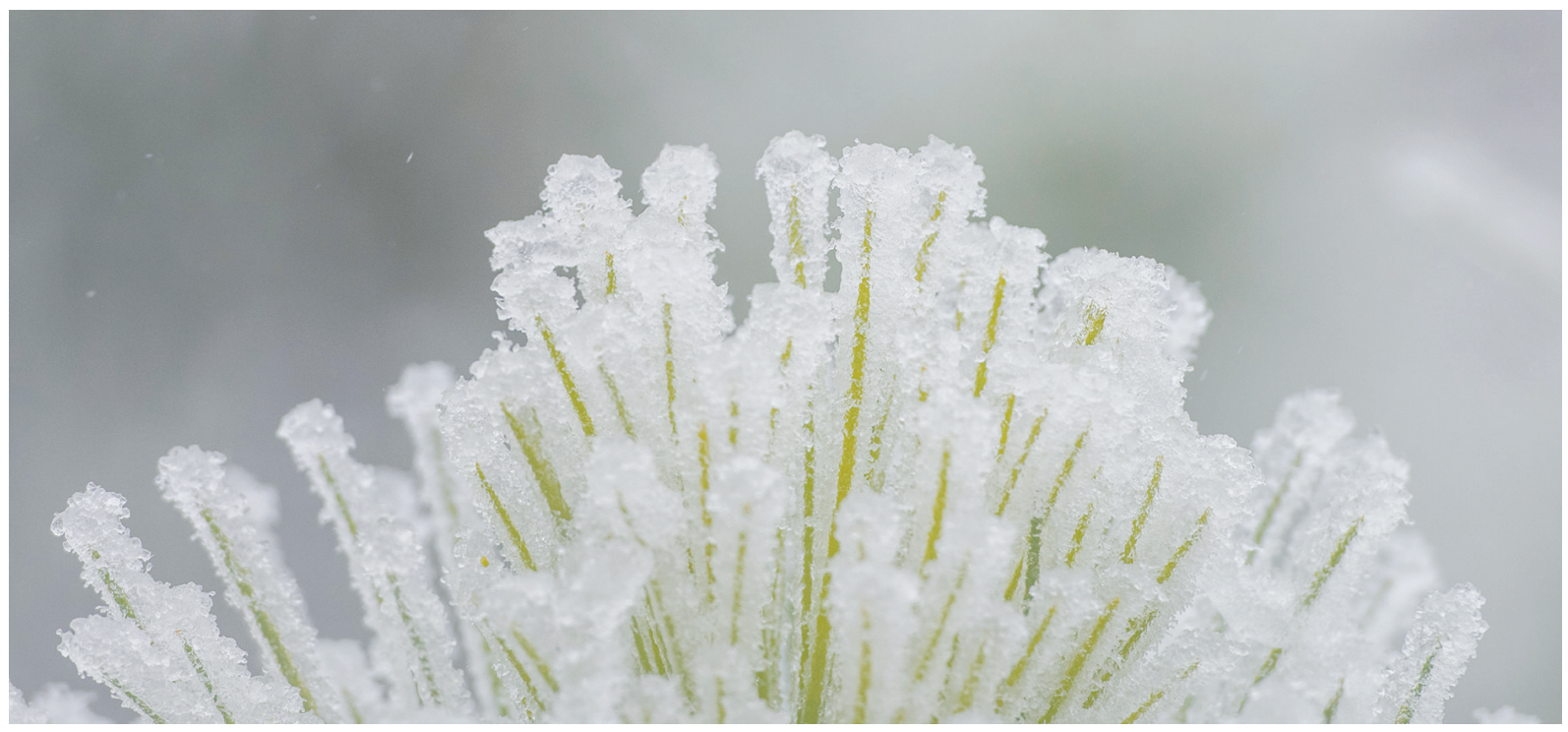
12月1日,在湖南省永州市道县洪塘营瑶族乡东江源村拍摄的植物。