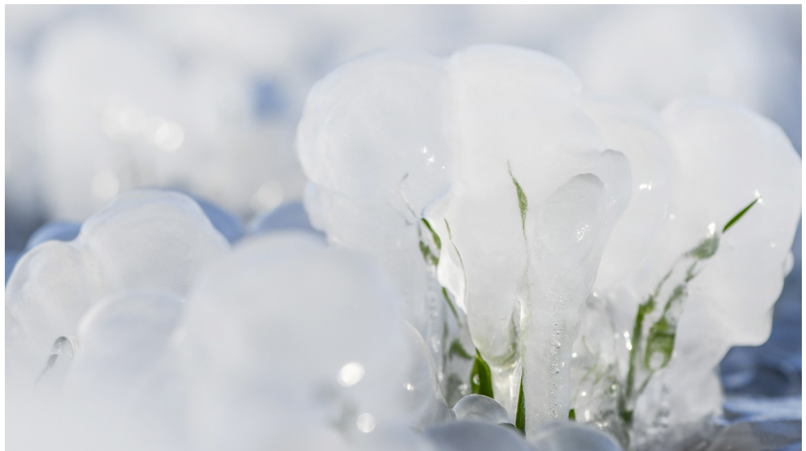
12月3日,在河北省遵化市东新庄镇拍摄的麦田冬景。