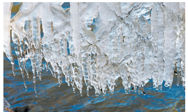
12月1日,天津市蓟州区于桥水库水岸的树木和水草挂上了冰凌。