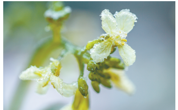
12月1日,在湖北省宜昌市秭归县茅坪镇拍摄的花。