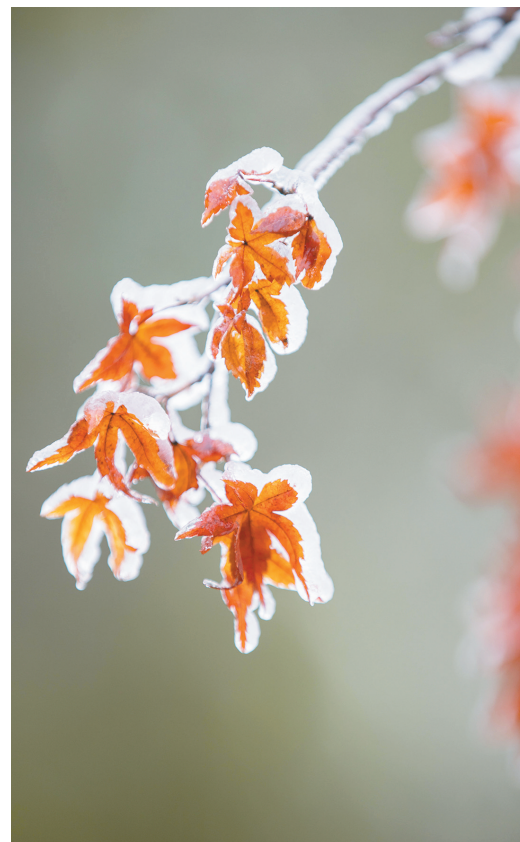
12月1日,在贵州省铜仁市万山区朱砂古镇,叶子上结了冰。

随着气温下降,仲冬悄然而至。近日,越来越多的地区迎来降雪,雪后寒冷加剧,许多植物身披“银装”,展现出别样的“冻态”美。雪花飘落,冰凌“绽放”,晨霜点缀……让我们一起欣赏摄影师镜头下的微观“冰雪世界”。