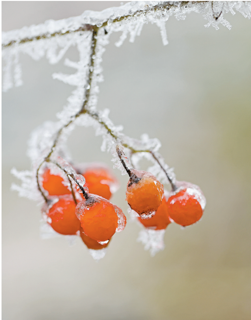
12月2日,在贵州省黔东南苗族侗族自治州岑巩县,果子结霜。