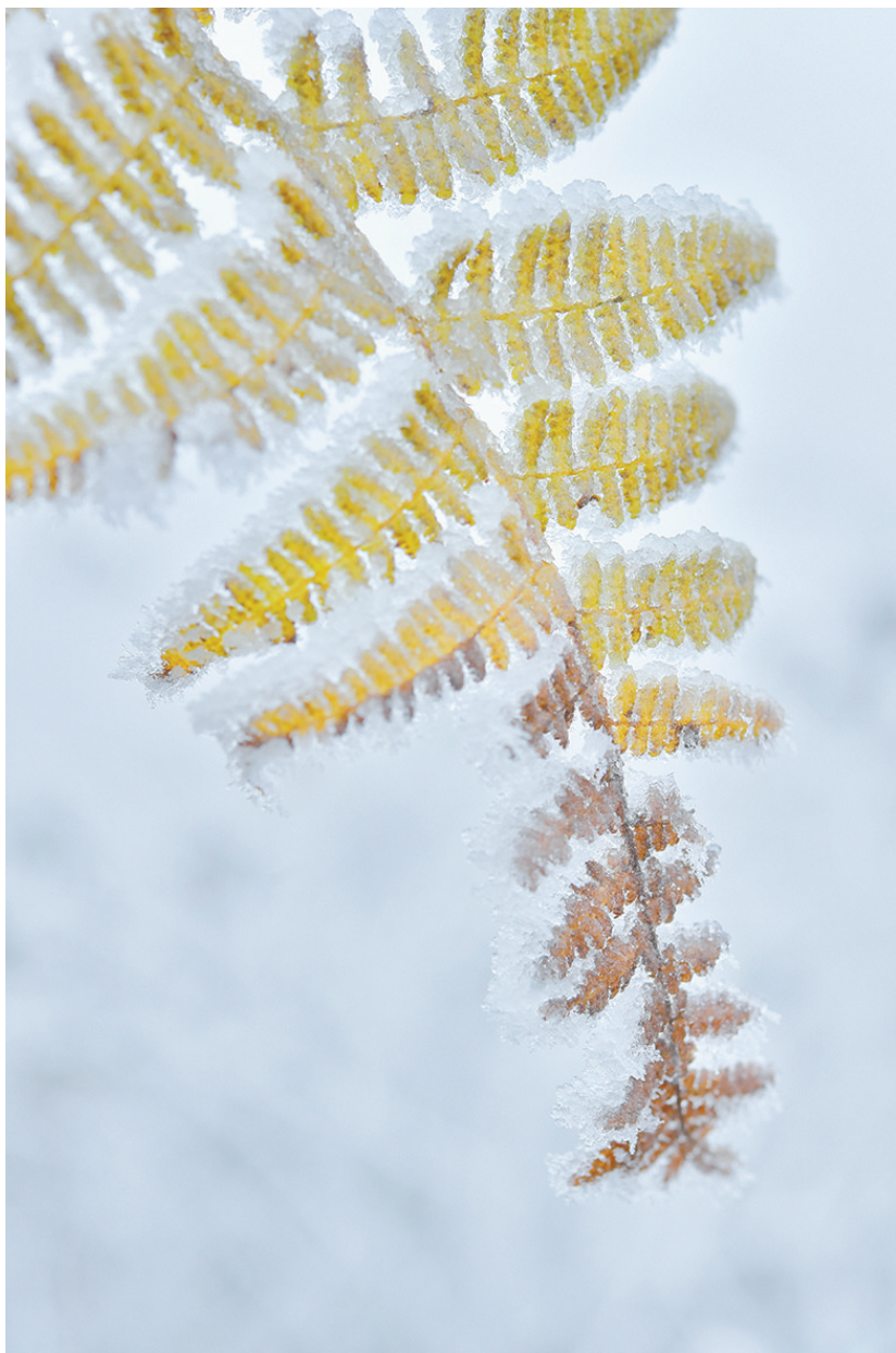
12月2日,在湖北省宣恩县沙道沟镇红旗坪村拍摄的被冰冻的植物。