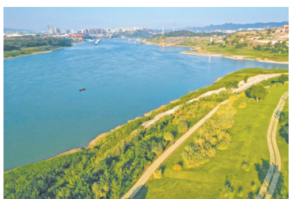
眼下正值三峡库区蓄水期,这是今年11月2日拍摄的重庆广阳岛消落带景象。