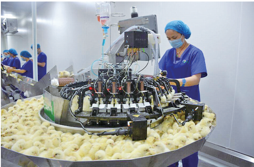
华裕农科雏鸡孵化中心。

丰都县生猪产业同样迅速崛起,通过引进东方希望、重庆农投集团带动生猪产业发展,已建成2个楼房式智慧