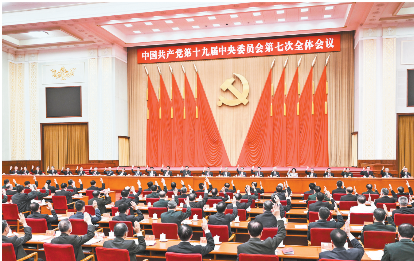
中国共产党第十九届中央委员会第七次全体会议，于2022年10月9日至12日在北京举行。中央政治局主持会议。