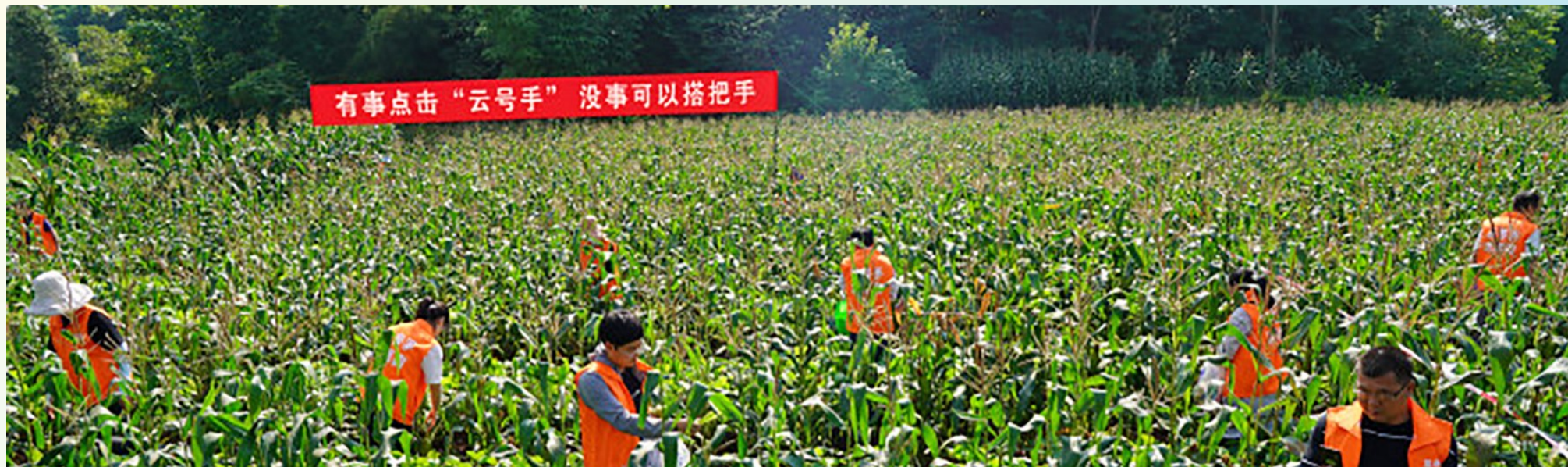
“云号手”志愿者助力撂荒地抢收活动。(资料图)

上线以来，8500余名党员、群众注册成为“云号手”志愿者，累计发布诉求1617个，认领或完成1598个，占98.82%。