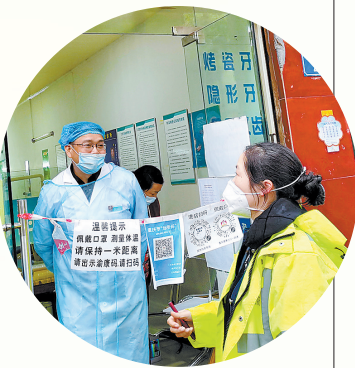
“党员先锋队”在疫情防控一线。(资料图)