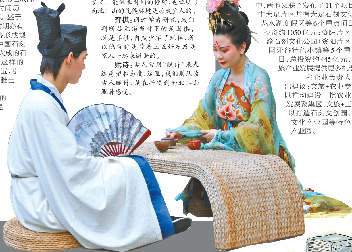
汉服爱好者还原古人避暑场景。