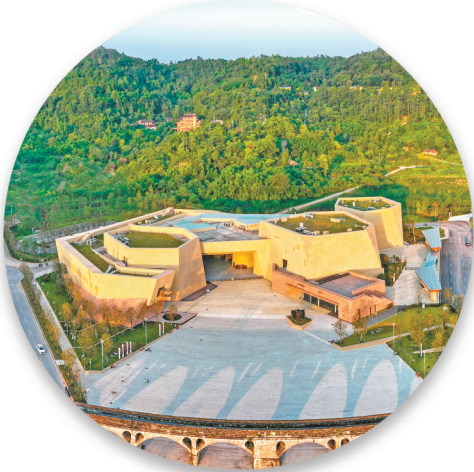
大足石刻游客中心全景。

按照调整后的大足山景区参观线路,游客须先到达新游客中心停车场,进入游客中心接待大厅,办理相关参观手续后,按以下线路乘