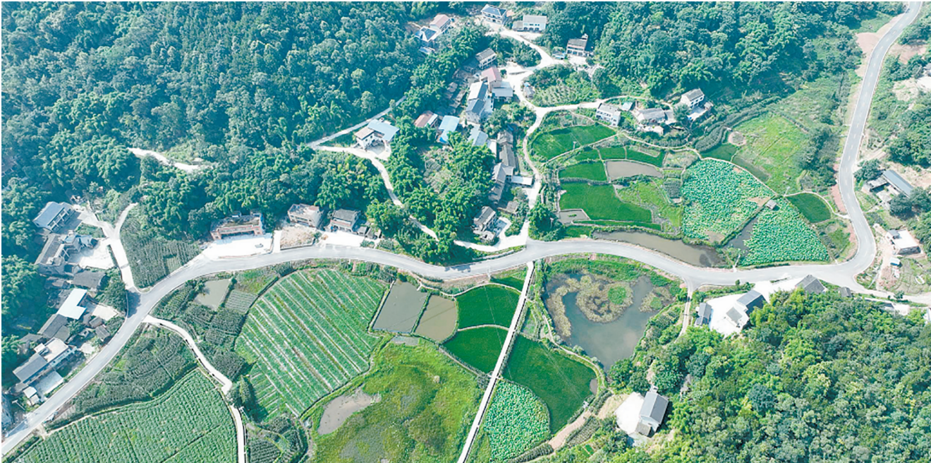
6月15日,航拍镜头下的大足雁溪镇玉峡村“四好农村路”,像一条玉带连通家家户户。