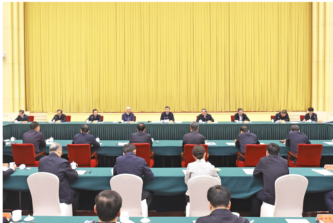
4月23日下午，中共中央总书记、国家主席、中央军委主席习近平在重庆主持召开新时代推动西部大开发座谈会并发表重要讲话。

●西部地区在全国改革发展稳定大局中举足轻重。要一以贯之抓好党中央推动西部大开发政策举措的贯彻落实，进一步形成大保护、大开放、高质量发展新格局，提升区域整体实力和可持续发展能力，在中国式现代化建设中奋力谱写西部大开发新篇章