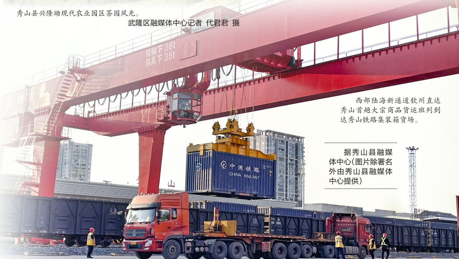
西部陆海新通道钦州直达秀山首趟大宗商品货运班列到达秀山铁路集装箱货场。

2023年，秀山通道运量增长超90倍，进出口贸易额同比增长278%。今年，预计全年可完成通道运量5000标箱以上，进出口贸易额突破5亿元。