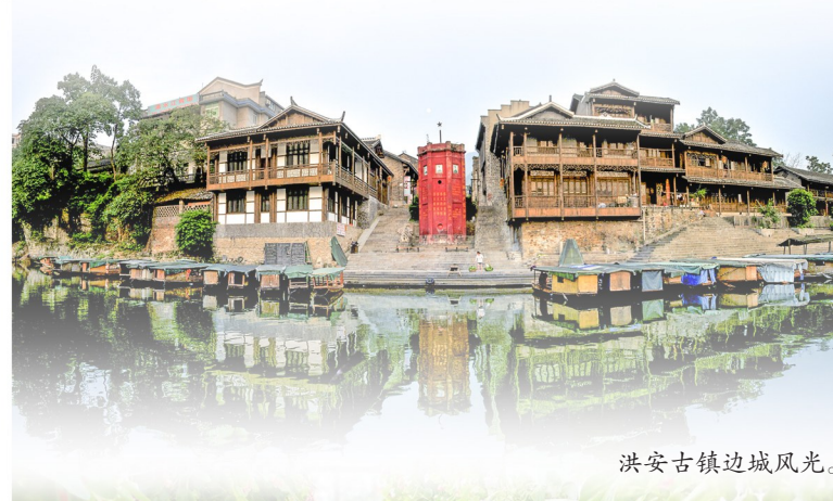
洪安古镇边城风光。

“书中边城·画里秀山”，画廊映新景，土家苗寨换新颜。洪安和川河盖是秀山当下生态旅游产业与乡村振兴有机结合下的华丽蝶变中的一个缩影，在幸福美丽的新篇章中，秀山的儿女们携手并进，在乡村振兴的大道上阔步前行。