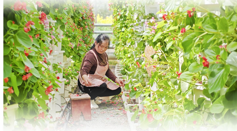
秀山现代农业科技展示馆内，工人正在打理盆栽。